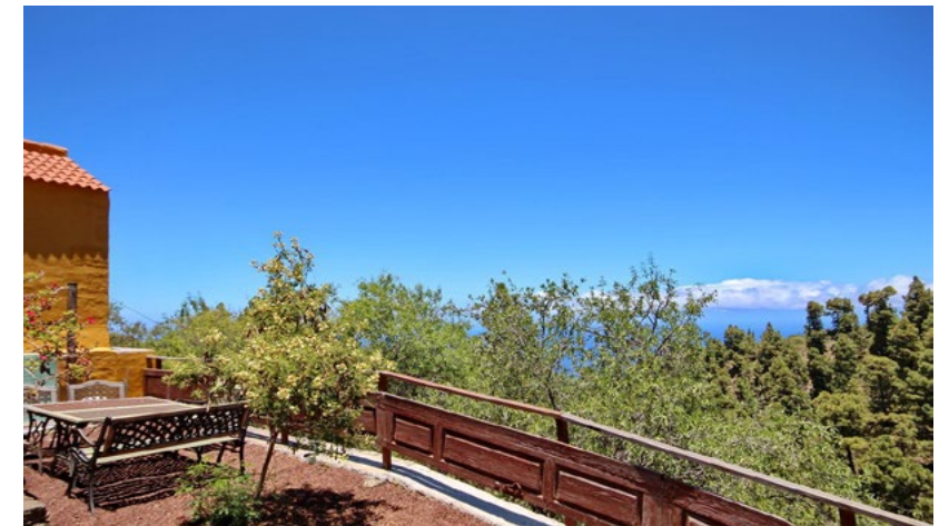
LAS TRICIAS 289.000 €

Liebevoll renoviertes kanar. Haus mit Grundstück u. Nebengebäuden Casa canaria cuidadosamente reformada con terreno y anexo