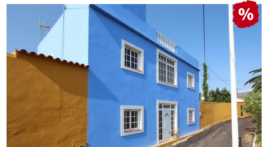
LOS LLANOS 325.000 €

Villa mit Pool und großem Garten Chalet con piscina y gran jardín