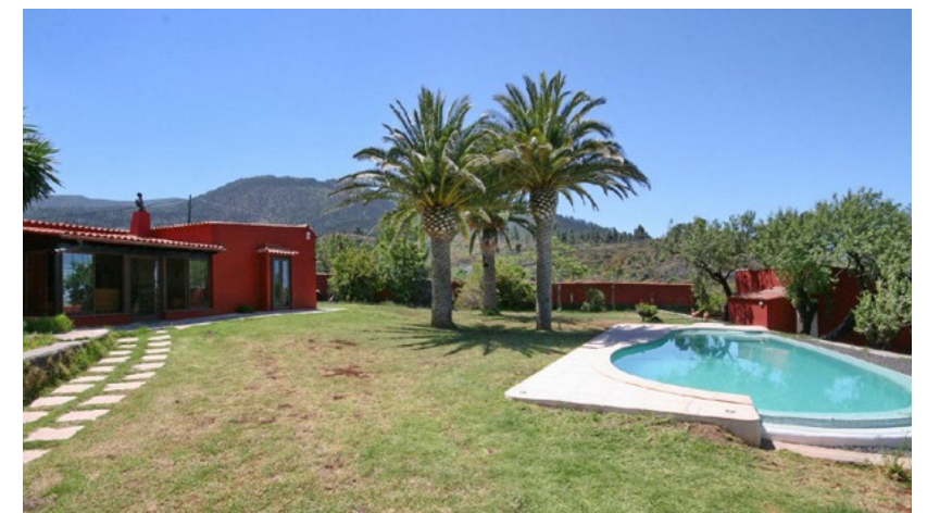
EL PASO 435.000 €

Liebevoll renoviertes kanar. Haus mit Grundstück u. Nebengebäuden Casa canaria cuidadosamente reformada con terreno y anexo