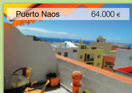
Puerto Naos 64.000 €