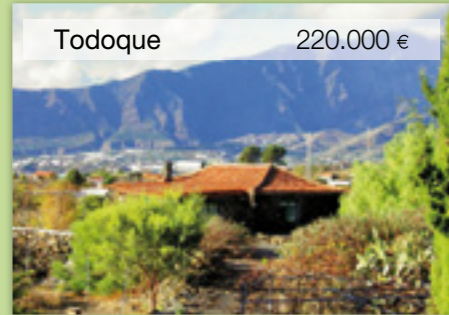
Todoque 220.000 €

Rustikale Finca ruhige Lage 97/1.600 m 2