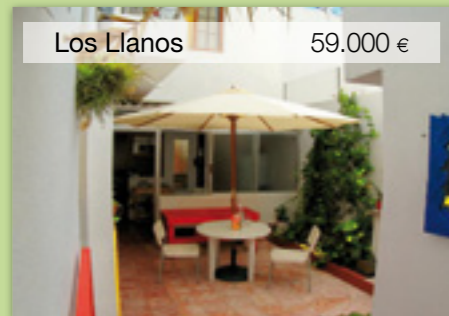
Los Llanos 59.000 €

Compra-venta y alquiler de PISOS CASAS LOCALES SOLARES FINCAS