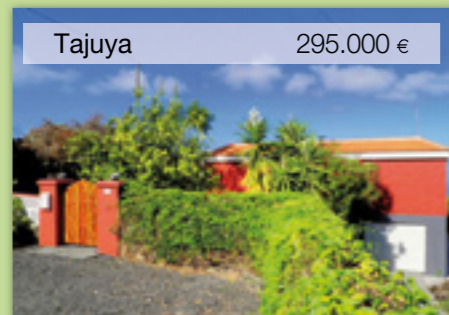
Tajuya 295.000 €

Doppelhaus 140 m 2 Wfl. Grundstück 6.500 m 2